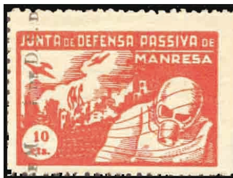
1937 - Manresa - dent. 11 Viñeta local de la Junta de Defensa Pasiva, catalogada en G.Guillamón, en una serie de 5 valores. Dibujo representativo de la capital Manresana bombardeada por aviones rebeldes.