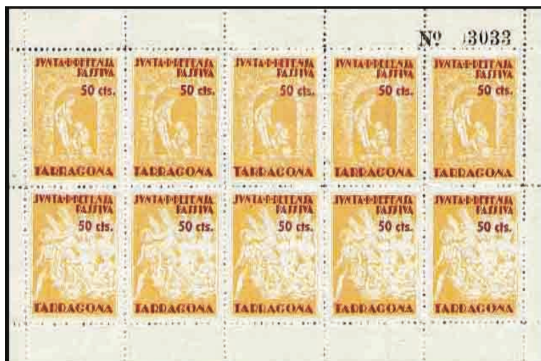
1937 - Tarragona - dent. 11 1/2 Viñetas locales de la Junta Defensa Pasiva, catalogada en G.Guillamón, en una serie de 16 valores (8 x 2), impresa en hoja de 10 viñetas (5 x 2). Dibujos representando diferentes motivos.