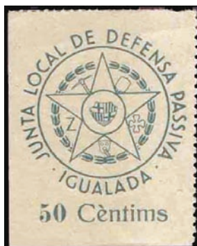
1937 - Igualada - dentat Viñeta local catalogada en G.Guillamón, en una serie de 3 valores. Dibujo representativo de un círculo con estrella de 5 puntas con el escudo de la ciudad y dibujos representativos.