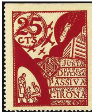
1937 - Girona - dent. 111/2 Viñeta local no catalogada en Sofima ni G.Guillamón, en una serie de 4 valores. Dibujo representativo de la capital Gerundense bombardeada por aviones rebeldes.