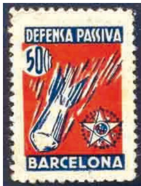
1937 - Barcelona - dent. 11 Viñeta local catalogada en G.Guillamón, en una serie de 3 valores. Dibujo representativo de los bombardeos representado por una bomba.