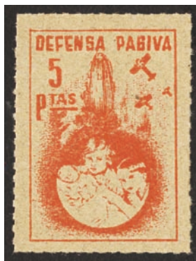
1937 - dent. zig-zag Viñeta política de la Defensa Pasiva, (Valencia) catalogada en G.Guillamón. Dibujo representativo de un refugio para familias ante los inminentes bombardeos rebeldes.

Se conocen emisiones en pueblos y ciudades de viñetas de la Defensa Pasiva catalogadas en "G.Guillamón y otros.": Barcelona, Castellón, Ciudad Real, Elche, Igualada, Madrid, Manises, Manresa, Murcia, S. Juan (Alicante), La Seu d'Urgell, Tarragona, Tarrasa, Torrent (Valencia).