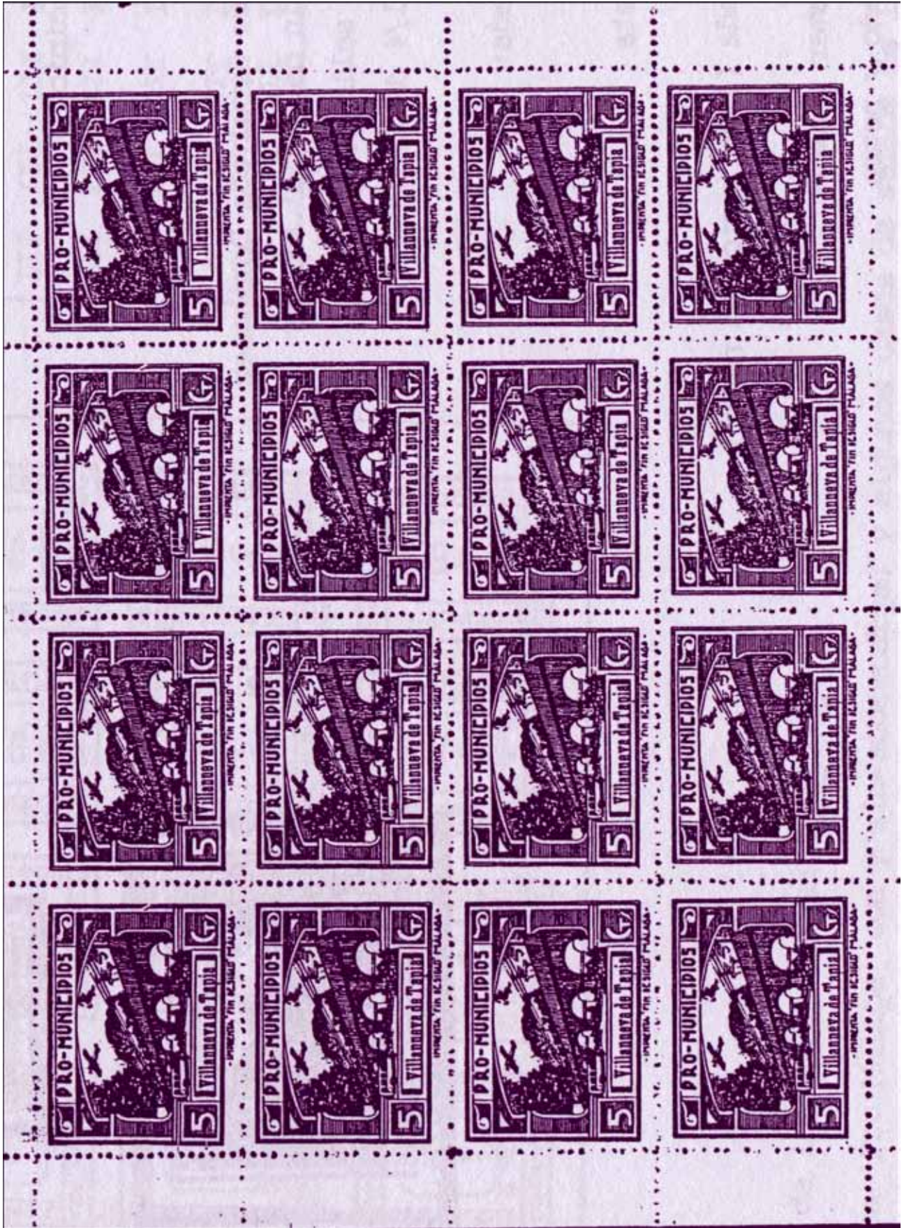
Pliego (girado 90°) de 16 viñetas con los dos bleques de 4 x 2