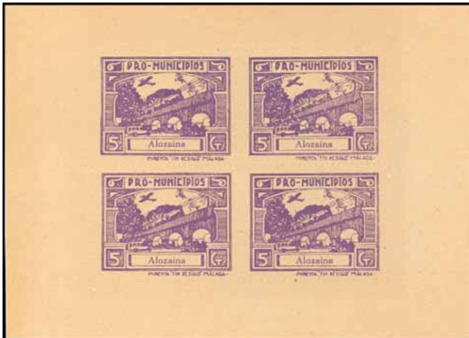
Bloque de los 4 falsos de las posiciones 1, 2, 3 y 4

2.- En el marco de la población, en su interior, en la zona superior derecha hay un punto de color. A veces no es visible por taparle las letras de la población.