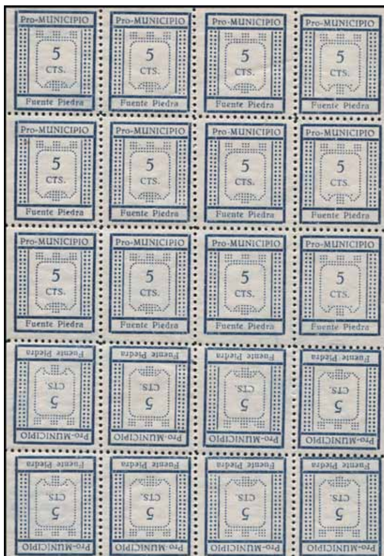
Hoja color azul con las parejas verticales capicúas