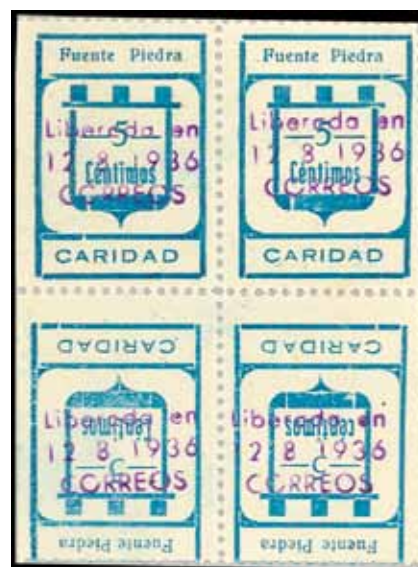
3Aa - 3Apvc