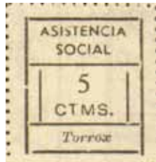
Tipo II Posiciones: 8-9-13-17-19