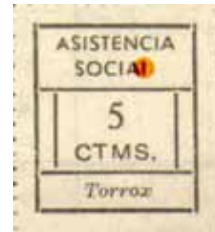
Tipo IIb Posición: 18