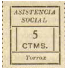
Tipo I Posiciones: 1-2-6-7-11-12-16