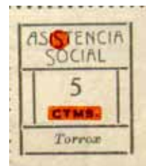
Tipo VII Posición: 20