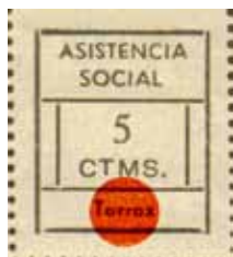
Tipo III Posiciones: 3-4