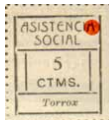
Tipo VI Posición: 15