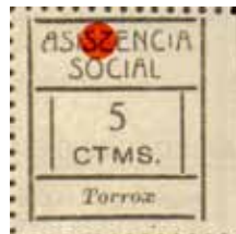
Tipo V Posición: 10