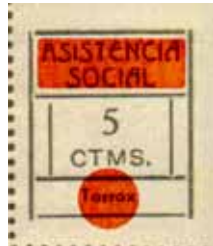
Tipo IV Posición: 5