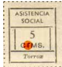
Tipo IIa Posición: 14